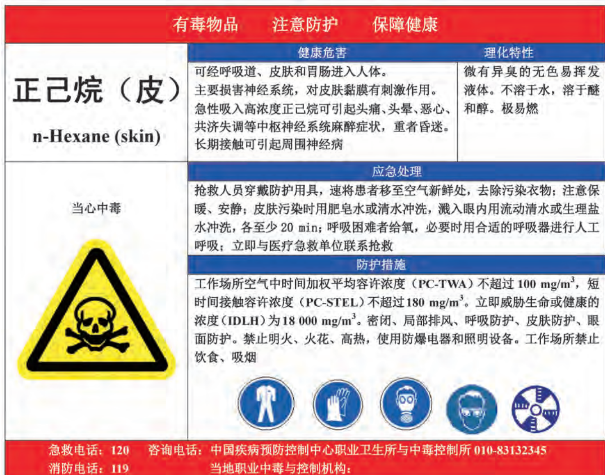
A.13 正己烷的告知卡见图 A.13。