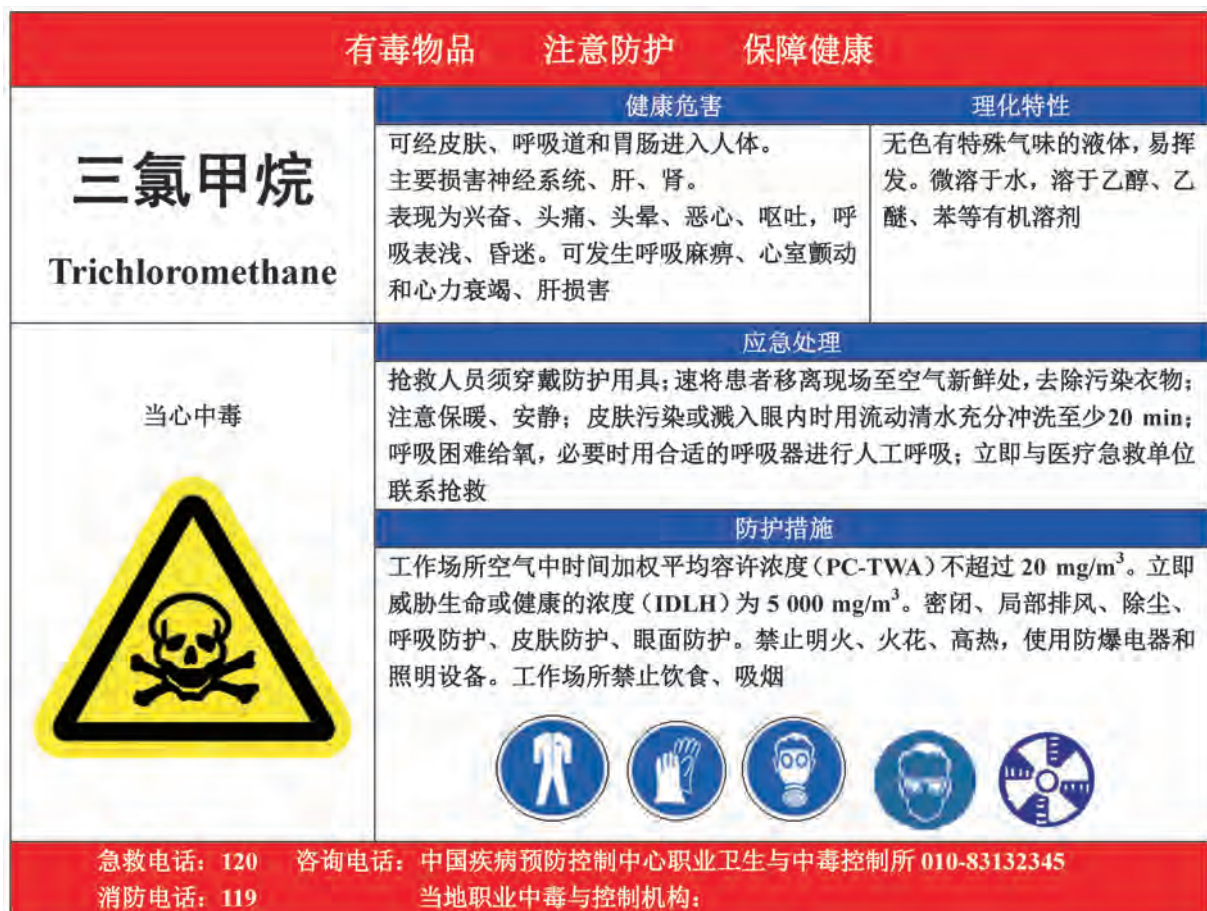
A.15 三氯甲烷的告知卡见图 A.15。