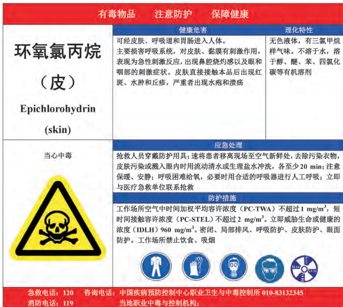
A.6 环氧氯丙烷的告知卡见图 A.6。