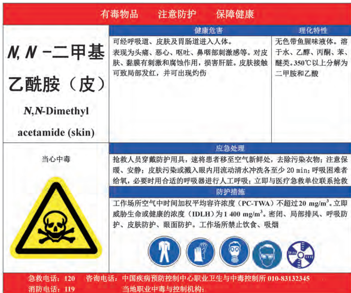
A.4 二甲基乙酰胺的告知卡见图 A.4。