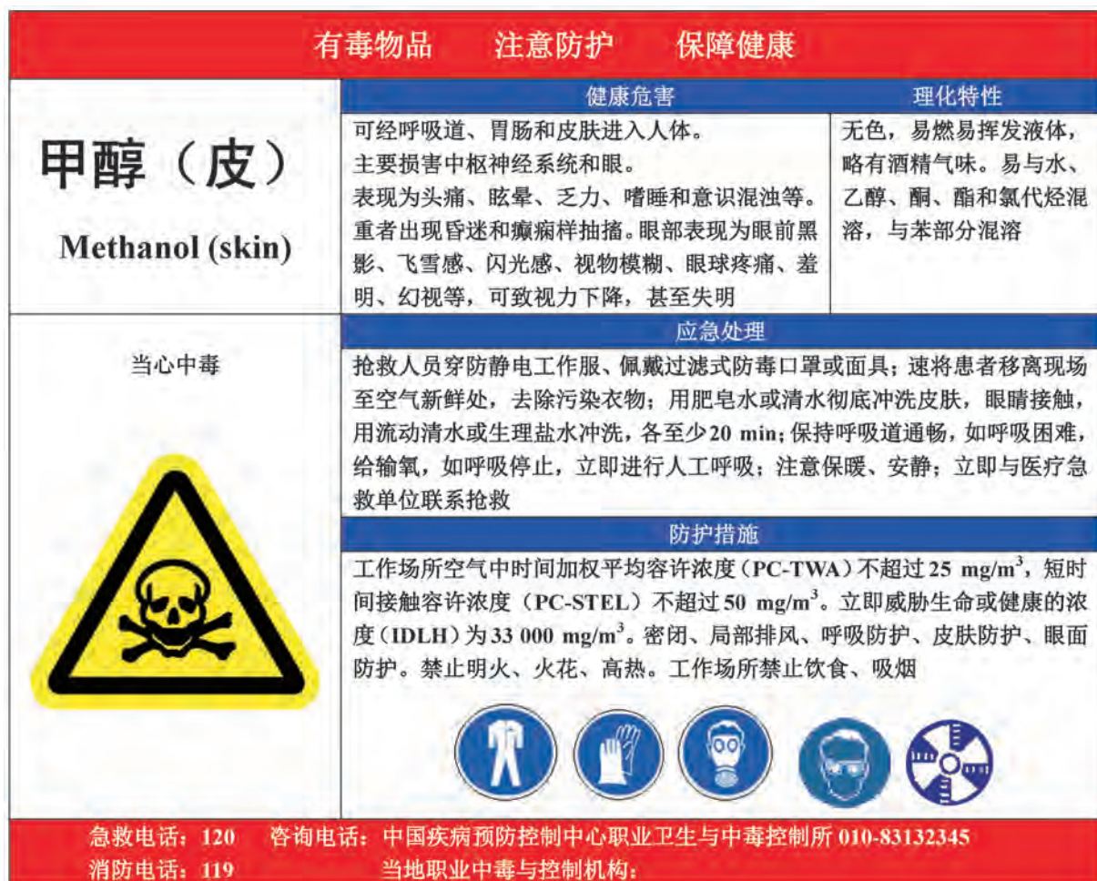
A.8 甲醇的告知卡见图 A.8。