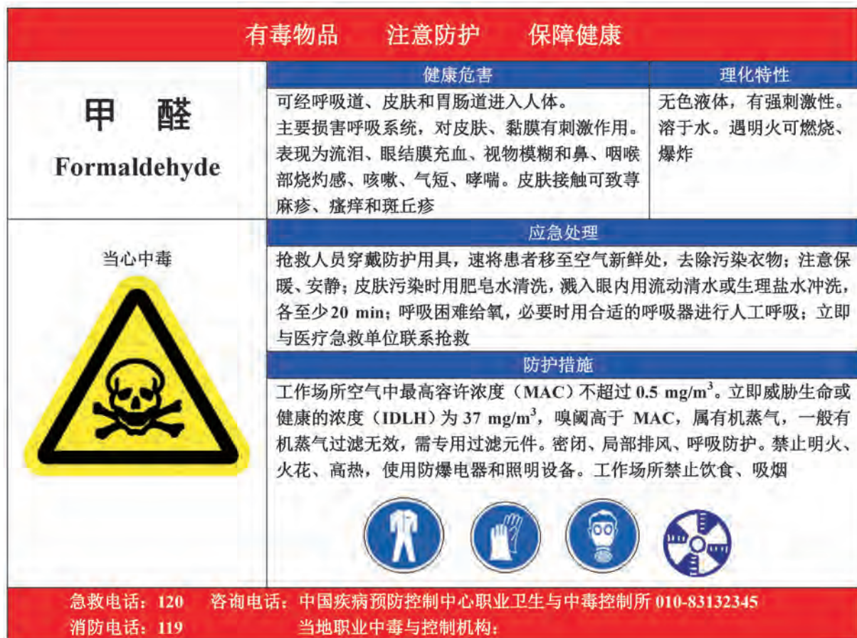
A.2 甲醛的告知卡见图 A.2。