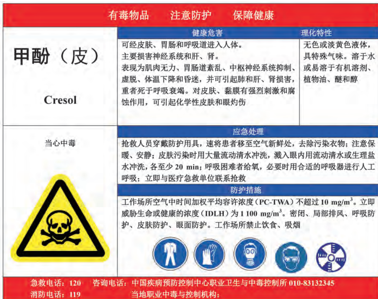
A.9 甲酚的告知卡见图 A.9。