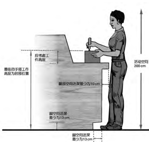
图 F.2 立姿工作要求的空间尺寸