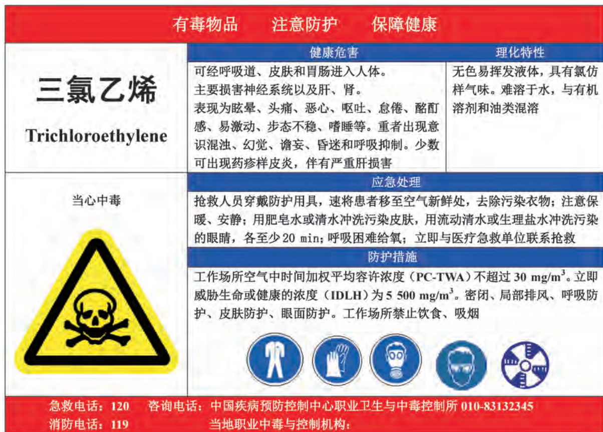
A.11 三氯乙烯的告知卡见图 A.11。