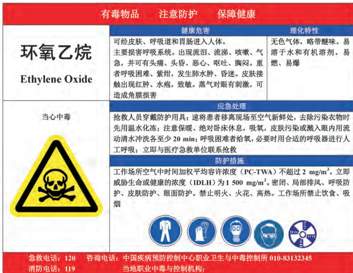
A.7 环氧乙烷的告知卡见图 A.7。