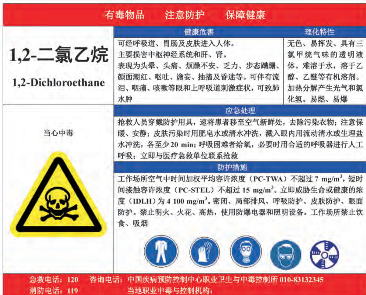
A.5 1,2-二氯乙烷的告知卡见图 A.5。