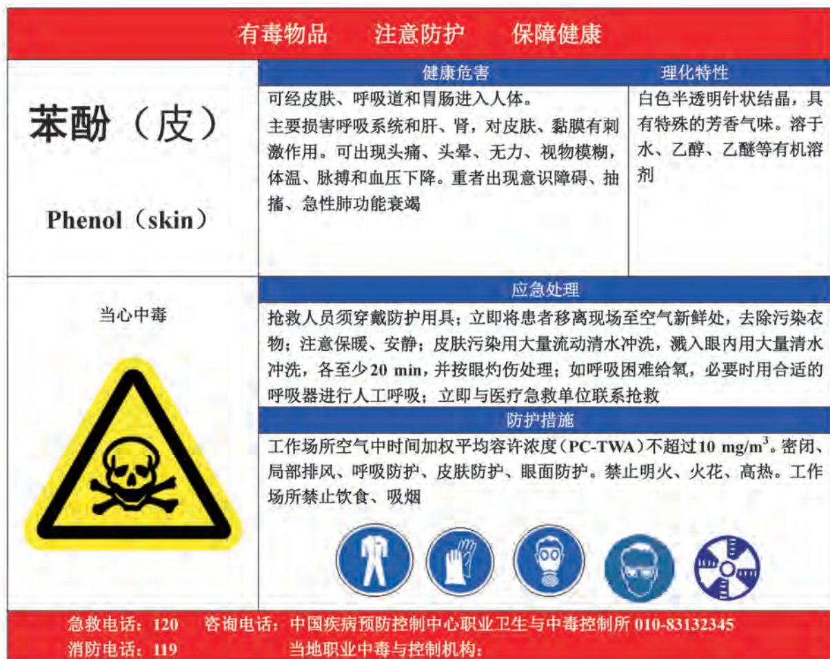
A.14 苯酚的告知卡见图 A.14。