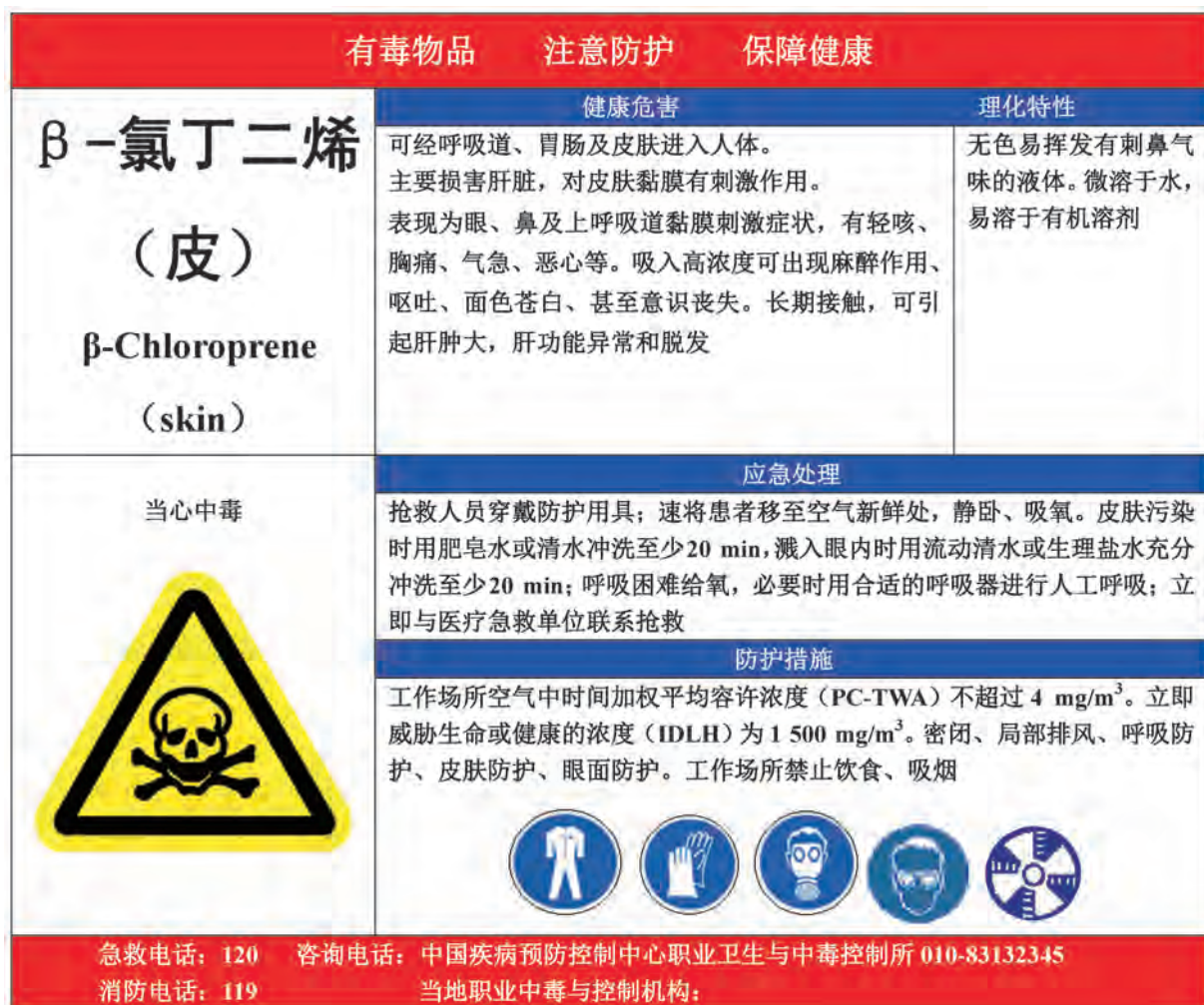
A.10 氯丁二烯的告知卡见图 A.10。